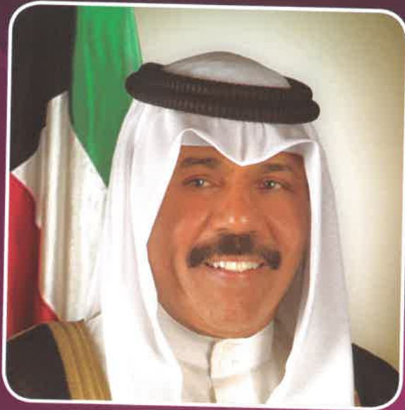
حضرة صاحب السمو ولي العهد الشيخ نواف الأحمد الجابر الصباح حفظه الله