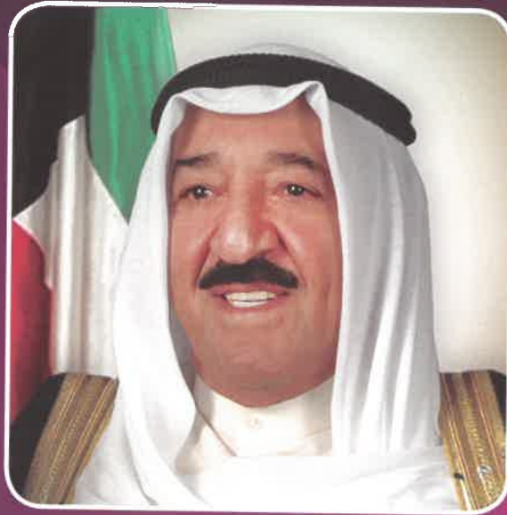
حضرة صاحب السمو أمير البلاد الشيخ صباح الأحمد الجابر الصباح حفظه الله